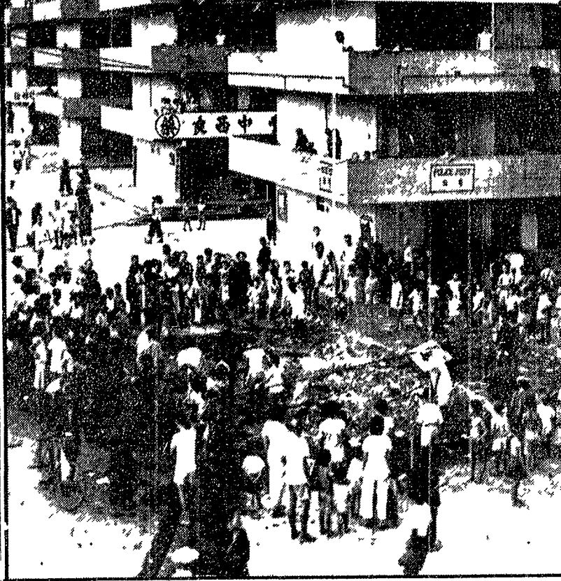
HONG KONG — Due immagini delle brutali repressioni inglesi nel 1967. Basterebbe che la Cina allungasse una mano per riprendersi Hong Kong...