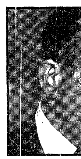
Uno dei difensori di Charles Manson

La morte dei coniugi Labianca - Manson grida: «Stai mentendo» - Scambio di invettive in aula - «Non sono bugie Charlie e tu lo sai» - Due avvocati della difesa arrestati