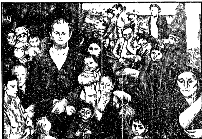
Danilo Dolci ritratto fra i proletari meridionali nel quadro « Le parole sono pietre » di Carlo Levi dipinto nel 1956

Il poema è stato scritto per la radio che funzionò dal 25 al 26 marzo di quest'anno, per iniziativa del Centro Studi diretto dal sociologo e poeta della non violenza a Partinico