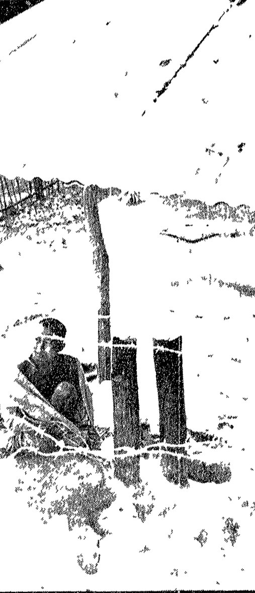
Un partigiano culturale dalle forze filostaliniane

Una serie di testi che dimostrano l'irriducibile volontà del popolo laotiano di resistere all'aggressione degli Stati Uniti