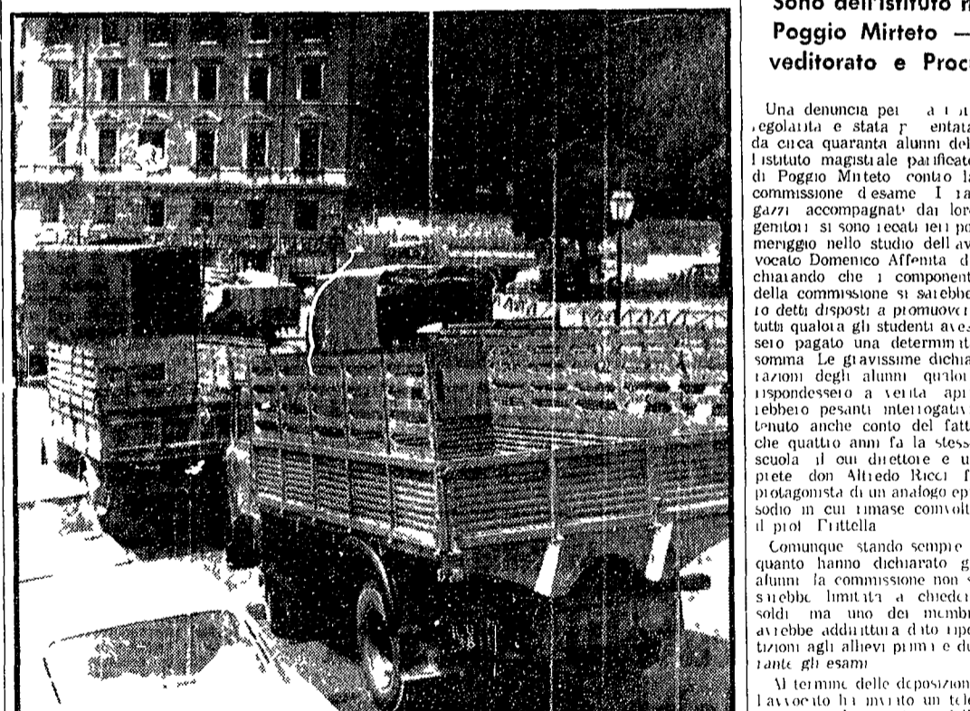
Finalmente le sessantaquattro famiglie che avevano occupato l'edificio di proprietà dei Beni Stabili al Colosseo sono state sistemate in appartamenti veri. Ieri mattina, come si vede nella foto, sono cominciati i traslochi: le famiglie si sono trasferite alla Magliana dove l'amministrazione comunale ha preso in affitto 200 appartamenti.

Finalmente una casa vera. Sono quelle che occuparono il palazzo dei Beni stabili al Colosseo - Ieri il trasloco in appartamenti affittati dal Comune alla Magliana. Le sessantaquattro famiglie che abitavano nel palazzo dei Beni stabili al Colosseo, sono state trasferite in appartamenti affittati dal Comune alla Magliana.