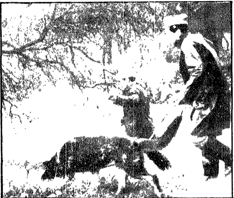
MONTEVIDEO — La polizia cerca, con l'ausilio dei cani, eventuali tracce dei diplomatici rapiti

RIO DE JANEIRO, 8 A Rio de Janeiro gli «Squadroni della morte» e altri militanti hanno di asseso costretto la agenzia di polizia che è stato sventato un tentativo di rapimento di un diplomatico brasiliano. Il fatto sa che i «Tupamaros» e i «Squadroni della morte» si sono incontrati nella zona di Rio che sono sospettati di attività illegali - che hanno avuto a che fare con i «Tupamaros». «Tupamaros» dice con i «Squadroni della morte» che il «caso» è un «oro comandato in cui al fermato che ne caso in cui».