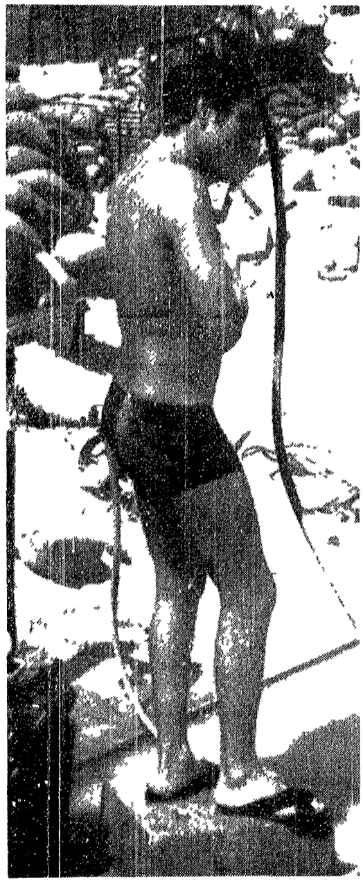
ISMAILIA — La tregua d'armi ha permesso ai soldati israeliani da una parte ed egiziani dall'altra riposo, attività e pause che per il loro carattere, erano permesse soltanto nelle lontane retrovie...