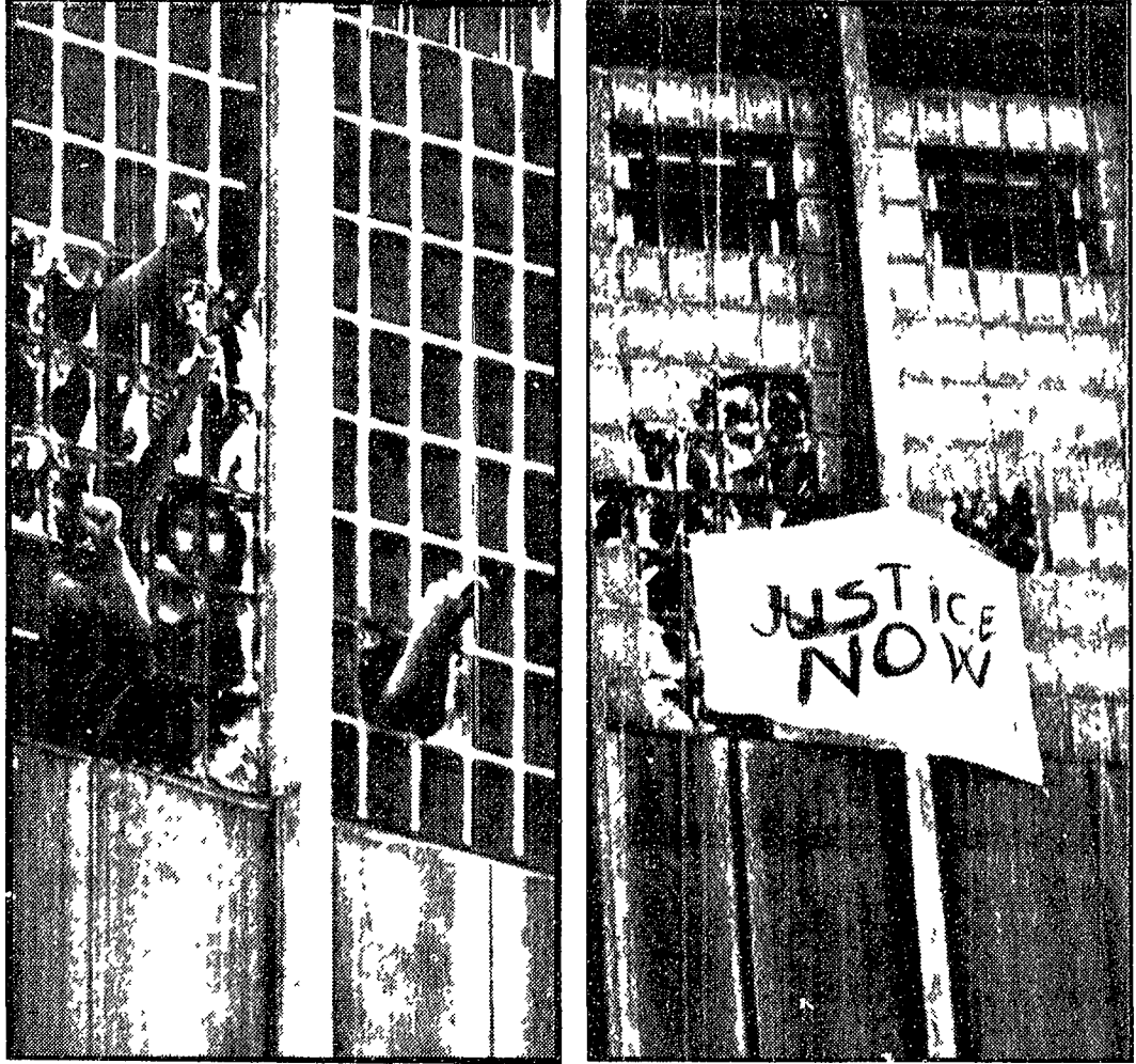
Due momenti della protesta dei detenuti nel carcere di Manhattan. Nel cartello si legge «Giustizia subito»

SUNNY POINT 12. Alla base navale di Sunny Point sono giunti stamattina i due treni carichi di gas nervini destinati ad essere affondati nell'Atlantico. I 14.500 missili tattici contenuti in gas racchiusi in cassoni di cemento armato, saranno collocati all'interno dello scafo di una vecchia nave e affondati con questa a 22 miglia ad est di capo Kennedy. Il governatore della Florida, Claude Kirk, ha fatto un tentativo per bloccare la micidiale operazione con un ricorso alla corte federale. Kirk accusa l'eser-