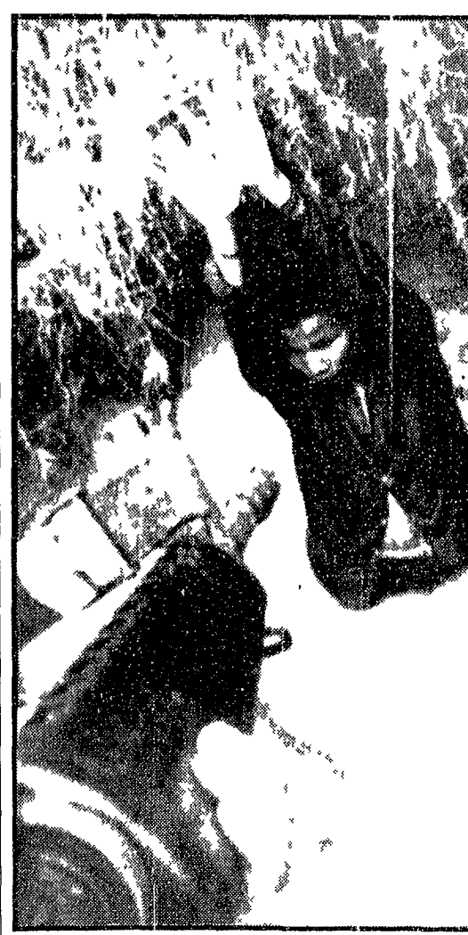
Un contadino cambogiano e tenuto sotto la minaccia di un'arma da fuoco col pretesto di aversare il regime fantoccio di Lon Nol

Stato e smentì dichiarando che se erano false ed smentite. La stampa americana ne parlò abbondantemente, studiando sul piano della tattica di guerra l'uso dei defolianti. Il Washington Post scrisse che «i prodotti chimici defolianti lanciati dagli aerei devono mettere a nudo le zone coperte di vegetazione dove i vietnamiti si nascondono e assaltano il loro cibo».