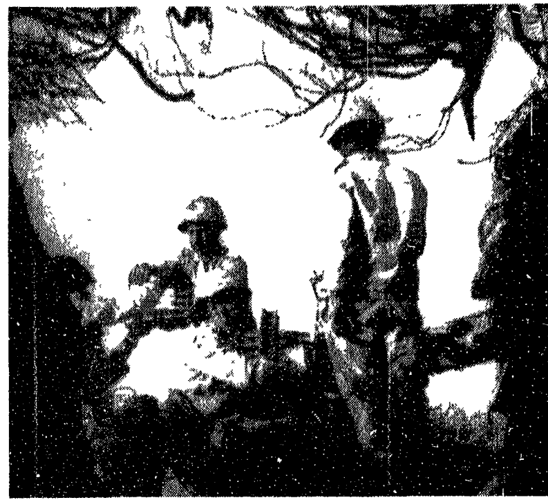
IL CAIRO — Una postazione antiaerea egiziana con i serventi al pezzo al loro posto