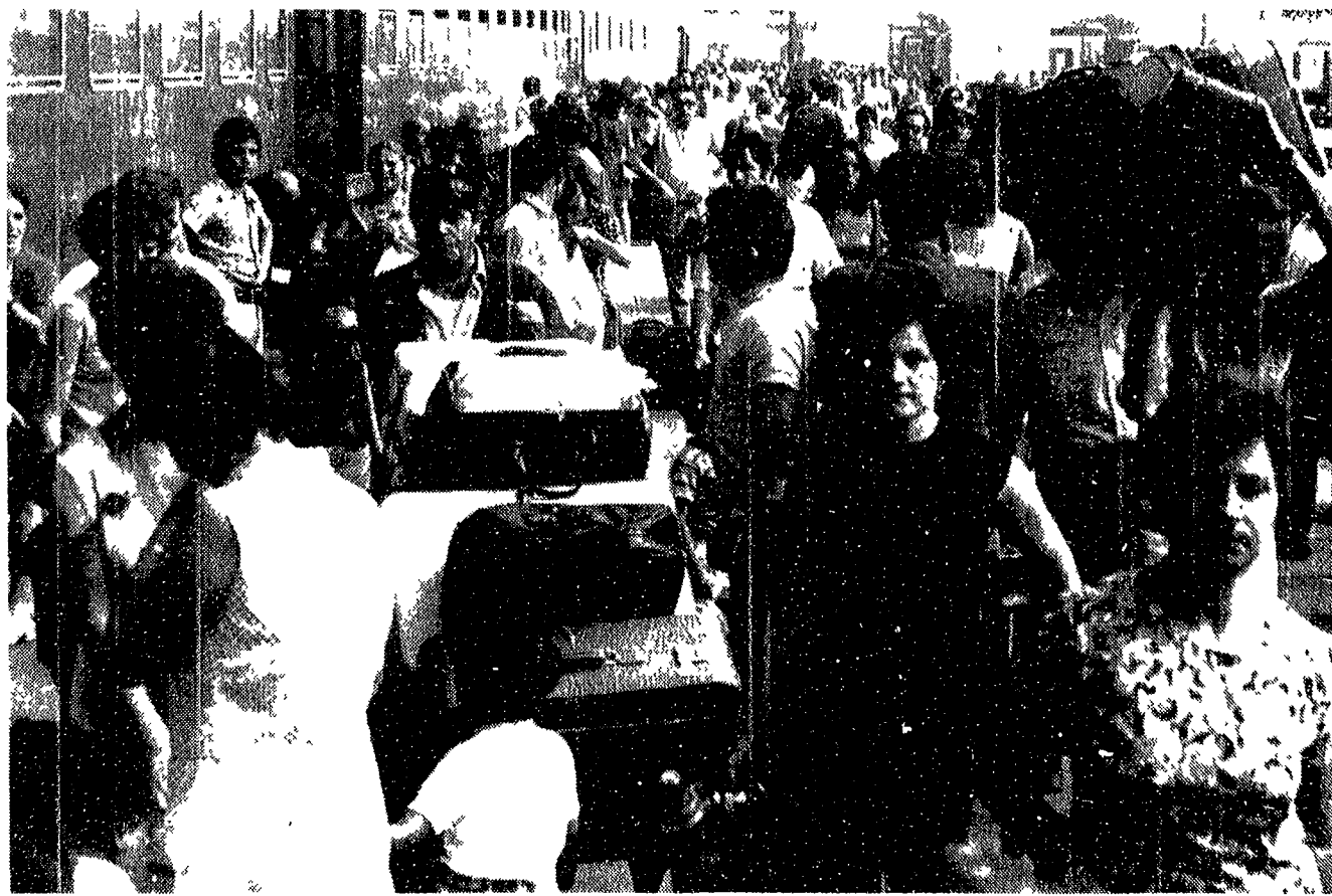
MILANO — Ressa alla stazione centrale l'operazione ritorno dalle ferie è in pieno svolgimento

Numerosi i morti in incidenti della strada - Tra le vittime c'è anche chi tornava dal lavoro, non dalle vacanze - Affollamento alle stazioni ferroviarie - Traffico intenso ma scorrevole sulle autostrade