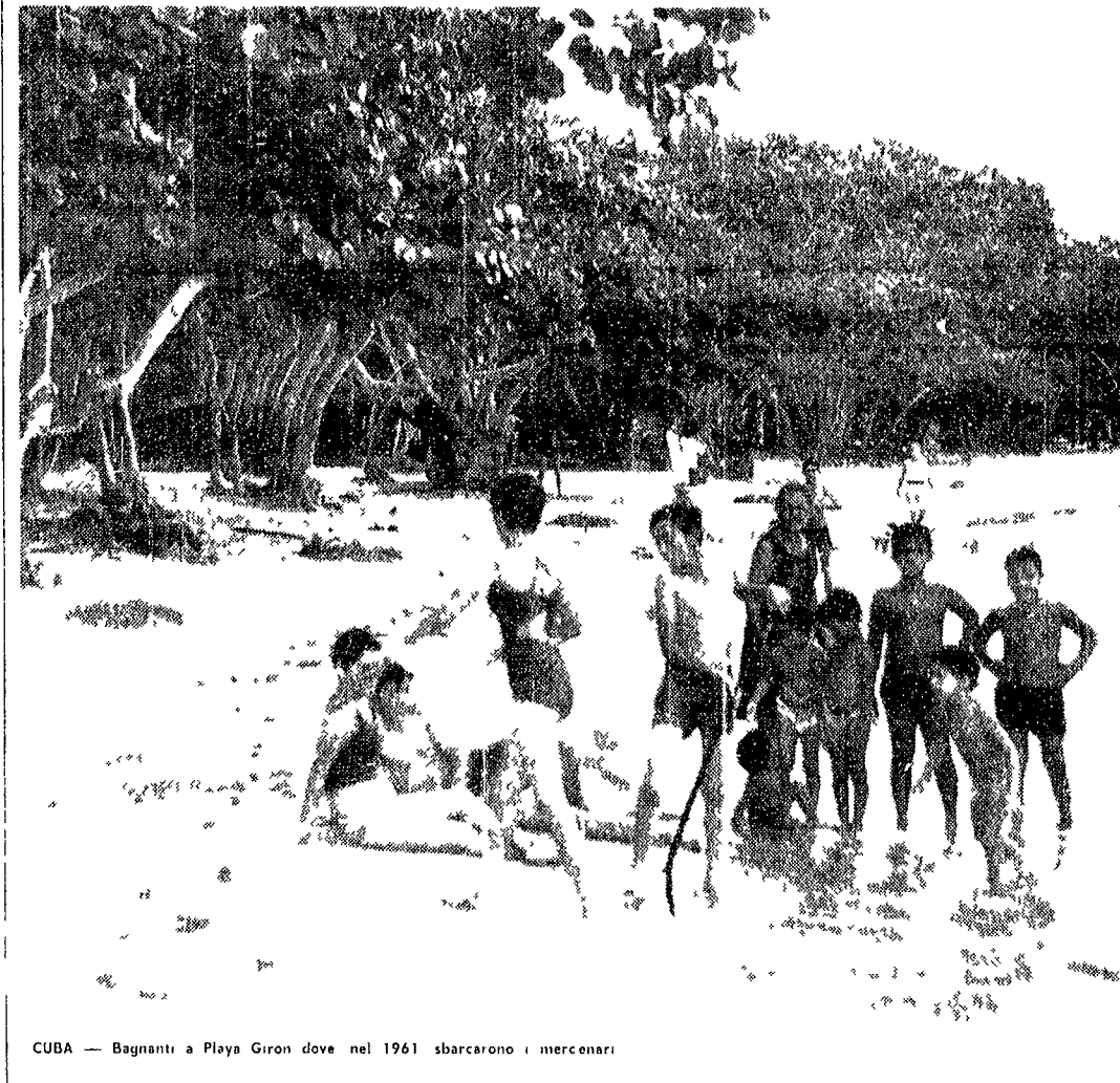
CUBA — Bagnanti a Playa Giron dove nel 1961 sbarcarono i mercenari

Puo' sembrare che l'iniziativa dell'Unità Vacanze di portare a Cuba i nostri turisti senza tecnica dell'Italturn... «Puo' sembrare che l'iniziativa dell'Unità Vacanze di portare a Cuba i nostri turisti senza tecnica dell'Italturn».