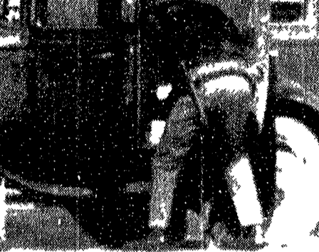
BUDAPEST 23 agosto. In politica estera le tendenze sono in netta opposizione con l'Unione Sovietica e con gli altri Paesi del campo socialista.

Alcune delle proposte presentate dal governo italiano per la riforma del sistema tributario.