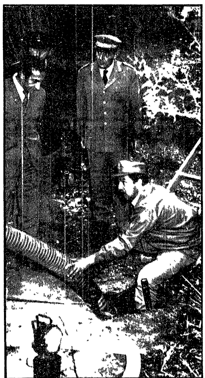
A PAGINA 4

Un brigadiere con coraggio e prontezza di spirito ha evitato una tragedia che avrebbe potuto avere le stesse proporzioni di quella del dicembre scorso a Milano