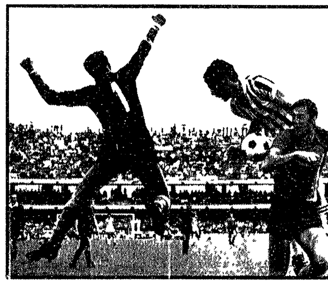
La Juve ha escluso anche l'ipotesi di una frattura...