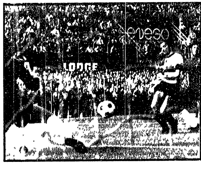
La Juve ha escluso anche l'ipotesi di una frattura...