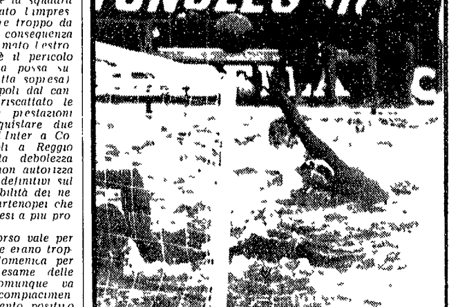
Una fase dell'incontro Italia Ungheria (disputato domenica), che ha visto gli azzurri pareggiare 3-3...