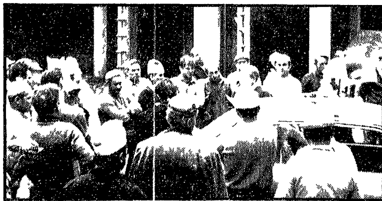
Assemblea di edili romani durante un recente sciopero