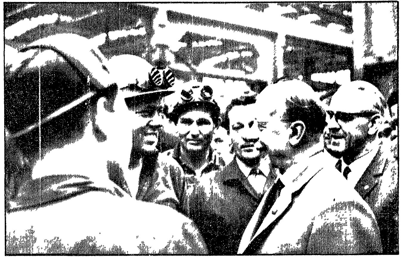
La didascalia di questa foto potrebbe essere anche straginata e breve Foto come questa...