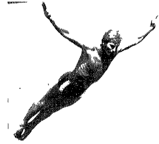
BOLZANO - Klaus Dibiasi in un tuffo dalla piattaforma di 10 metri

Bolzano 20 settembre. Nella giornata conclusiva dell'evento internazionale di tuffi Europa Stati Uniti Klaus Dibiasi ha vinto la gara della piattaforma dei dieci metri.