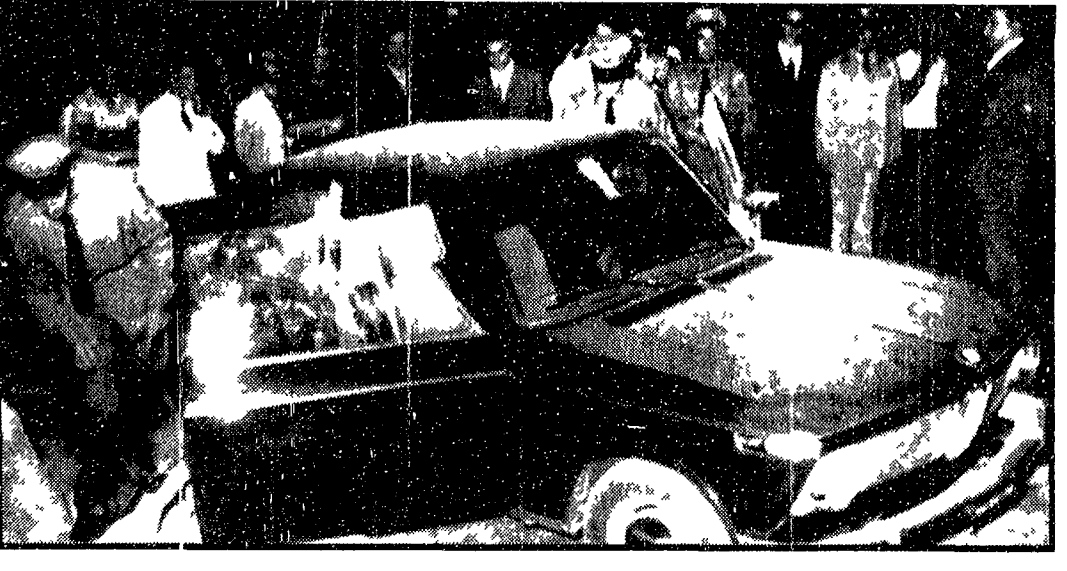
L'auto del giornalista sequestrato dalla mafia: alcuni agenti vi frugano alla ricerca di qualche traccia.

Non è neppure da vendicare l'ipotesi di una vendetta che rientrerebbe nel più classico stile mafioso. Qualche cosa si è appreso dai documenti di una delle tante inchieste di De Mauro e una volta uscito dal carcere dopo tre venticinque anni di reclusione, si è recato a Palermo a fare il suo lavoro di giornalista.