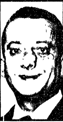
Mauro De Mauro

In una tasca dell'auto usata per il sequestro è stato trovato un biglietto con appunti sulla speculazione edile - Connessioni con la strage di Viale Lazio - Lotta tra cosche mafiose - Una dichiarazione del vice-capo della polizia - « Aiutateci », scrive « L'Ora »