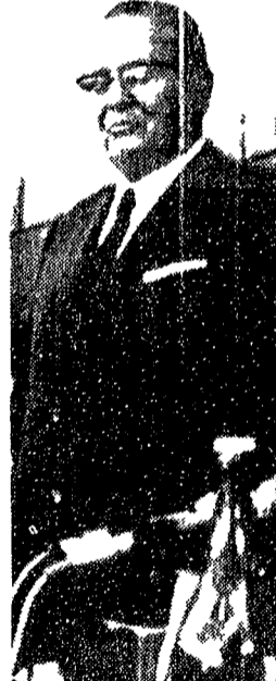
ZAGABRIA — Tito mentre pronuncia il suo discorso.

Il nuovo organismo sarà costituito da una direzione collettiva che sostituirà il presidente della Repubblica e avrà la possibilità di prendere decisioni senza doversi consultare con il Parlamento per operare in maniera più spedita