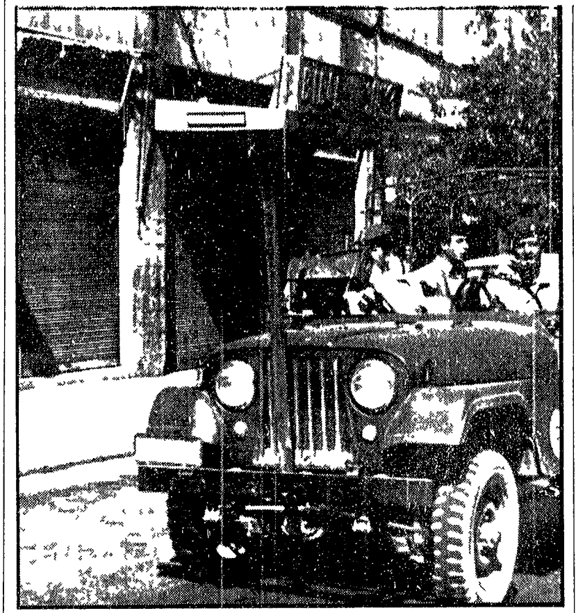
GERUSALEMME - Una pattuglia motorizzata israeliana perlustra le vie della città durante lo scoppio dei combattimenti arabi proclamato in segno di lutto per i massacri compiuti dalle truppe giordane ad Amman

«L'impetuismo non ignora tutto ciò che hanno tentato molti costanti di noi come contro la resistenza e l'insurrezione del movimento nazionale arabo».