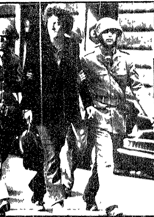
Poliziotti e carabinieri hanno fermato ieri quasi 500 giovani, indiscriminatamente, in un'azione di polizia...