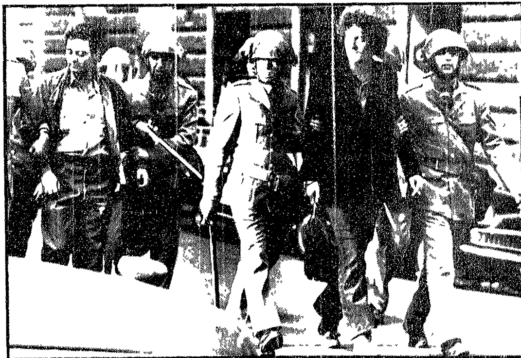
Poliziotti e carabinieri hanno fermato ieri quasi 500 giovani, indiscriminatamente, in un'azione di polizia...