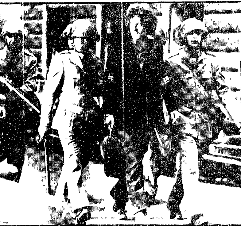
Poliziotti e carabinieri hanno fermato ieri quasi 500 giovani, indiscriminatamente, in un'azione di polizia...