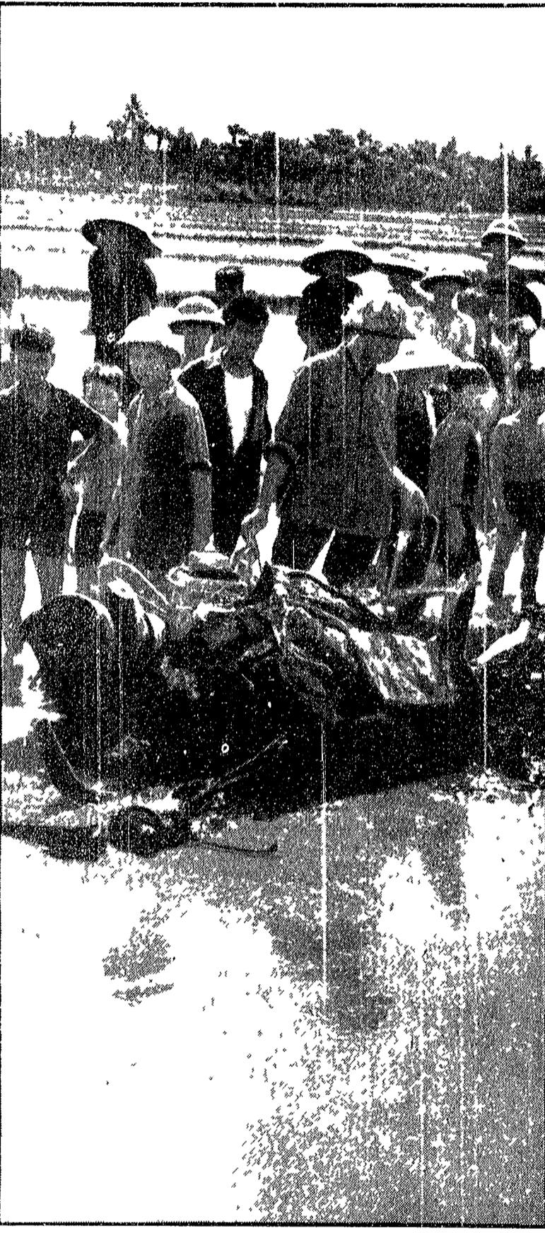
Un aereo spia americano abbattuto in provincia di Thanh Hoa

Una visita a Vinh, capoluogo della provincia di Nghe An - L'avvertimento dal « centro » - Un lavoro di convinzione che richiese tre mesi buoni