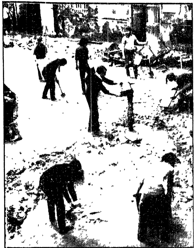
GENOVA - La città sconvolta cerca, con la forza dei suoi giovani, dei lavoratori, delle organizzazioni popolari di riparare ai danni ingenti dell'alluvione che ammontano, in tutta la provincia, a circa 500 miliardi. All'angoscia delle popolazioni, aggravata dal maltempo che torna ad incomberne, si è aggiunta l'esasperazione e l'amarezza per il decreto governativo, che annuncia misure del tutto insufficienti, incapaci di sanare anche le ferite più gravi. Nella foto: gruppi di giovani al lavoro nelle strade ancora invase dal fango. A PAGINA 8