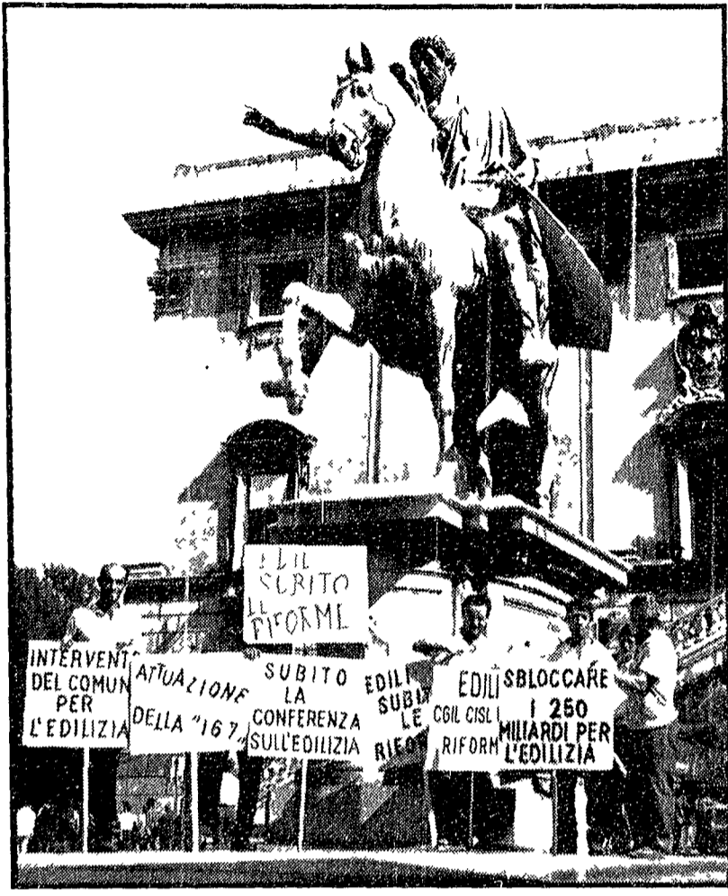
Nella foto i lavoratori edili mentre protestano sulla piazza del Campidoglio

I cantieri fermi dalle 12 — Alle 14 appuntamento in piazza Esedra da dove partirà il corteo che raggiungerà la sede dei costruttori — Da tre anni gli operai della Metalfer senza marche assicurative — Sciopero di 48 ore dei Vigili del Fuoco