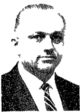
Il vice ministro degli Esteri polacco Zygfryd Wolnak (in alto)