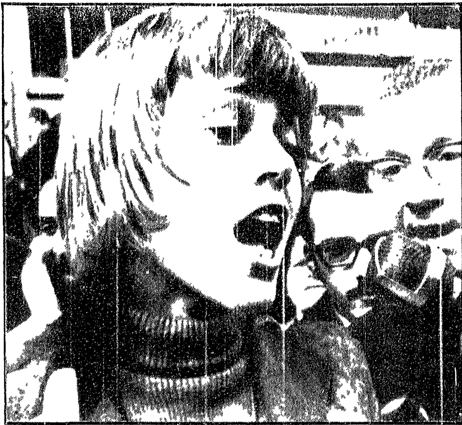
JANE FONDA INCRIMINATA. A Cleveland, in un'aula di tribunale controlata da un imponente schieramento di polizia, il magistrato federale ha riconosciuto « valide » le argomentazioni dei capi di accusa contestati all'attrice Jane Fonda...