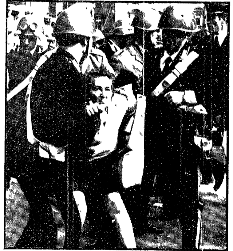
La risposta del governo ai terremotati del Belice, che da 7 giorni stavano davanti a Montecitorio, è stata lo sgombero con la forza. Celere e carabinieri hanno anche distrutto l'accampamento che era andato sorgendo davanti alla Camera. I deputati comunisti hanno subito presentato un'interrogazione.