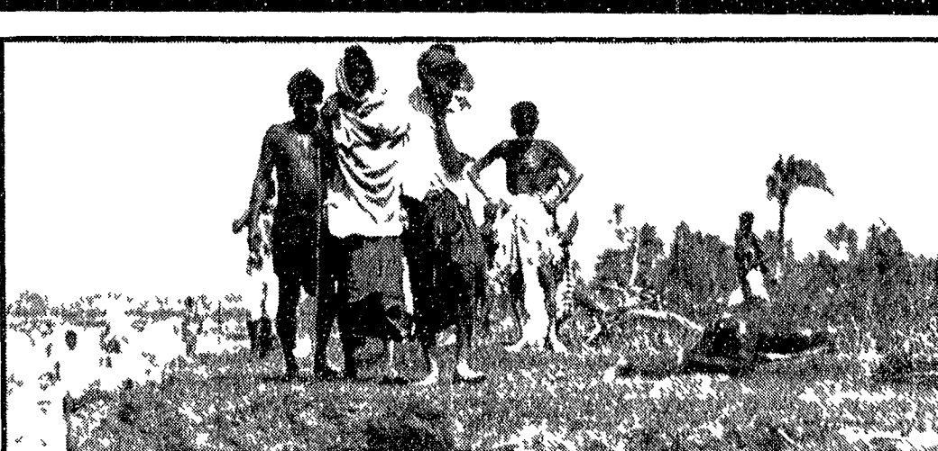
Gli scampati — tre milioni di uomini — dopo una settimana dal cataclisma continuano a morire. Sono in pratica lasciati soli nella ricerca di cibo di acqua e di medicine. Un giornale di Dacca scrive che i morti per colera sarebbero già 30. Nel Pakistan e nel mondo scoppia così lo scandalo per l'inaspettabile assenza di soccorsi.

La discussione in corso nel aula di Montecitorio sul «decretone bis» è stata spesa nella tarda serata di ieri. I lavori riguardano tutti gli emendamenti e saranno 11. Il presidente della Camera Palmiro Togliatti ha presenziato al primo tentativo di raggiungere un'intesa conclusiva. I vari gruppi in relazione a questo tentativo che ieri i deputati comunisti hanno ribadito il proprio atteggiamento in merito al confronto parlamentare in atto «Noi comunisti» ha dichiarato il compagno Barca vicepresidente del gruppo del PCI.