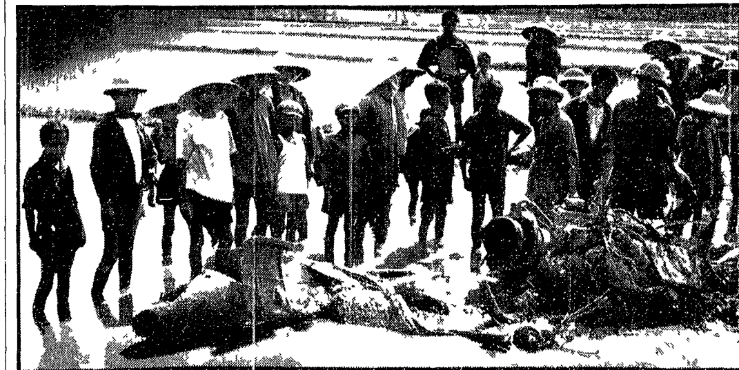
I resti di un aereo americano abbattuto nel Nord Vietnam

Tempestosa seduta al Senato americano - I particolari sull'escalation aerea e sull'operazione di commandos presso Hanoi suscitano vivo allarme - Kennedy e Fulbright denunciano i gravi atti di guerra voluti dal Presidente - Dimostrazioni di protesta a Mosca, Stoccolma e Parigi contro gli aggressori - Monito del governo cinese - Si preparano manifestazioni in molte città italiane