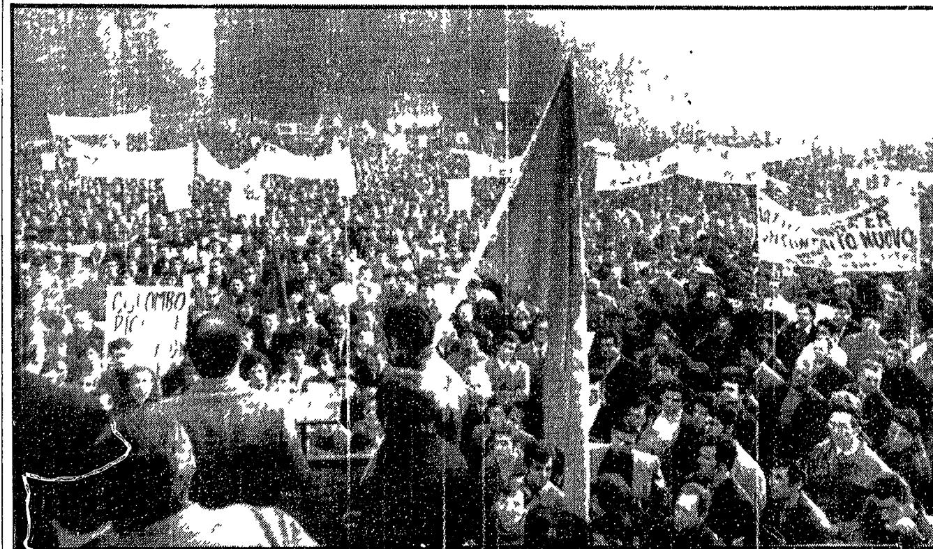
MILANO - Piazza del Duomo gremita di metalmeccanici e gommisti milanesi in lotta rispettivamente per rivendicazioni aziendali e per il contratto