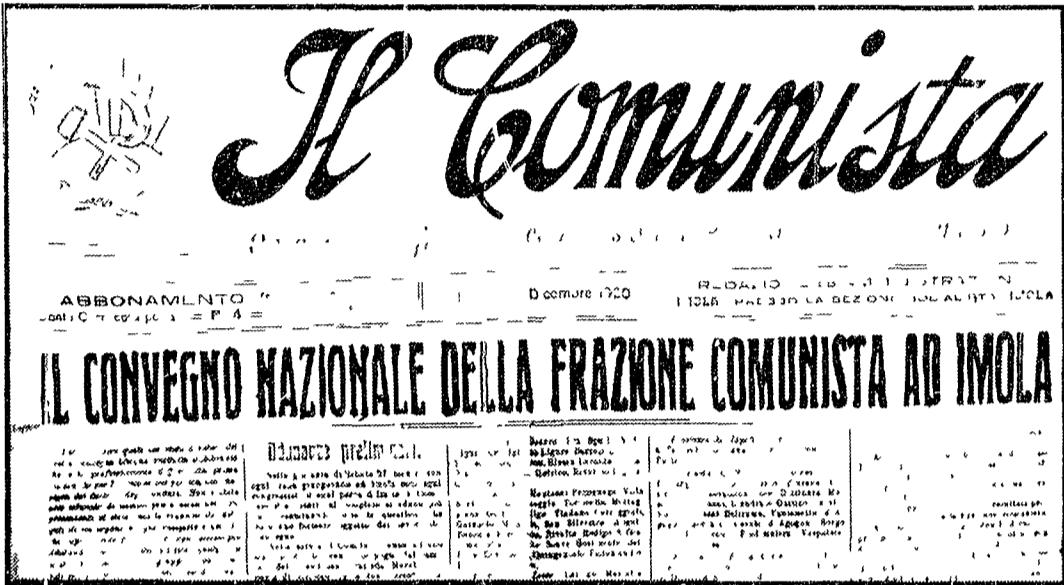
«Il comunista» il 5 dicembre 1920 pubblicava il resoconto dei lavori al convegno nazionale della frazione comunista ad Imola

Gli aiuti militari USA aumentano l'impopolarità del regime dei colonnelli «Via Nixon!» si grida nei cinema di Atene 300 modernissimi carri armati per un valore di 100 milioni di dollari in arrivo dall'America - Verso la costituzione di un Consiglio unitario della Resistenza