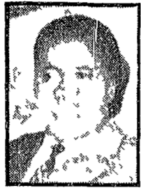
SEKU TURF. Chi è dietro i portoghesi

STOCOLMA 28. La Conferenza mondiale per la solidarietà con i popoli indocinesi si è aperta stamane a Stoccolma nella magna di un edificio neoclassico. Il primo giorno è stato dedicato al commento dei documenti e dei discorsi di apertura.