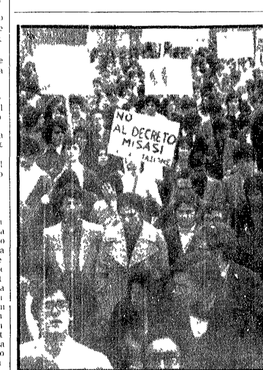
CAGLIARI. Uno scorcio della manifestazione studentesca di ieri.

Fermate del lavoro nelle fabbriche, chiuse le università e le scuole, dimostrazioni e scontri con la polizia - Domani il tribunale militare basco giudica sedici imputati, per alcuni dei quali è stata confermata la richiesta di condanna a morte - Per la stessa giornata i comitati contro la repressione e le commissioni operaie hanno organizzato le nuove proteste in tutta la Spagna