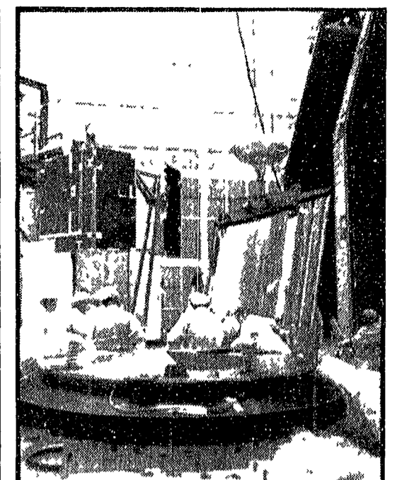
PARTITO BENE MA L'IMPRESA È FALLITA

CAPE KENNEDY. L'impresa di mettere in orbita un gigantesco telescopio spaziale, una impresa a lungo preparata dagli americani con un investimento di quasi 100 milioni di dollari, è fallita.