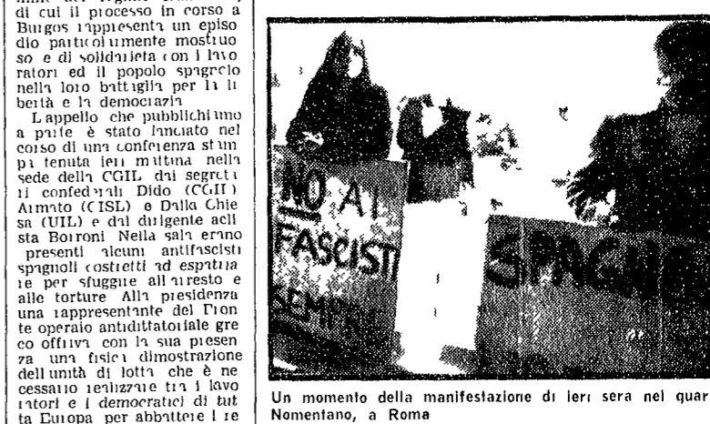
Un momento della manifestazione di ieri sera nel quartiere Nomentano, a Roma

I lavoratori italiani sono stati chiamati dalla confederazione delle CGIL, CISL e UIL con l'adesione delle ACLI a sviluppare una grande campagna di proteste contro le violazioni del regime franchista, di cui il processo in corso a Burgos rappresenta un episodio particolarmente mostruoso... «Bisogna andare fino allo sciopero generale nazionale per strapparli al carnefice».