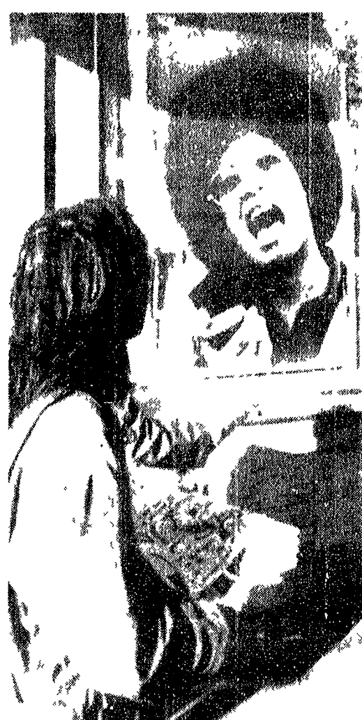
ROMA - Una giovane distribuisce materiale propagandistico davanti al locale dove si svolge la manifestazione per Angela Davis

ROMA - Grande assemblea di solidarietà con i negri americani