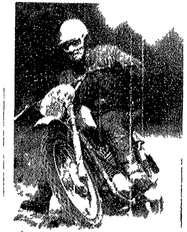
Una moto «Jawa» impegnata in un tratto fuori strada