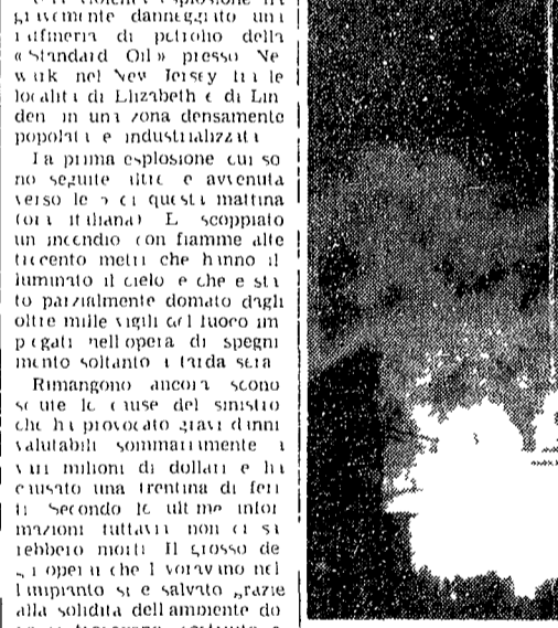
Una visione notturna dell'incendio

Una violenta esplosione ha devastato una raffineria di petrolio della Standard Oil presso Newark nel New Jersey. L'incendio è iniziato a mezzanotte e si è esteso a una zona densamente popolata e industrializzata.