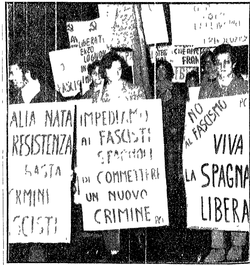
Un momento della manifestazione di ieri sera lungo via Trionfale a Monte Mario

Le sezioni e i comitati di quartiere si sono riuniti per discutere le iniziative da prendere contro il regime di Franco. Le iniziative si svolgono in questi giorni in tutta la città e in tutta la provincia.