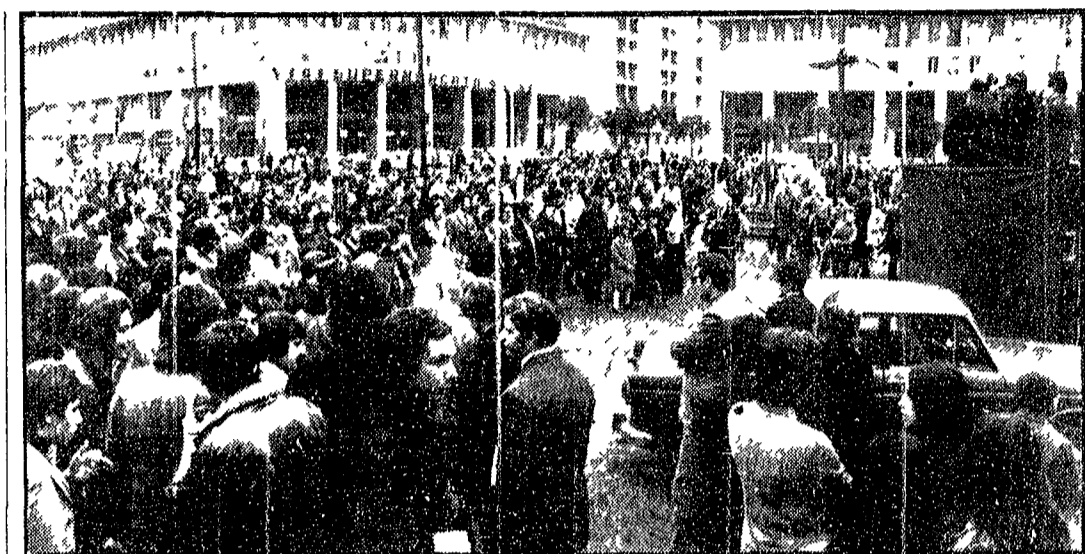
Una forte manifestazione antifascista si è svolta ieri mattina in piazza S. Giovanni Bosco per iniziativa del PCI, DC, PSU, PSI e PSIUP. Hanno ascoltato le parole degli oratori migliaia di persone, convenute nella piazza del popolare quartiere di Cinecittà per esprimere il loro sdegno contro la vile provocazione tentata da gruppi leppisti missini e per esprimere la loro protesta contro il regime franchista e il processo di Burgos.

Stasera, a ore 17,30, si terrà una manifestazione di protesta indetta dai movimenti giovanili del PCI, del PSI, del PSIUP e delle ACLI. Un corteo fino a piazza di Spagna dove si terrà una veglia - Una manifestazione a Centocelle contro il fascismo.