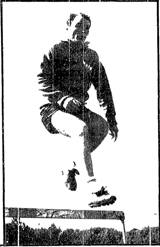
ALTAIRINI, nella sua veste di ex rossonero, sarà certamente uno dei protagonisti più attesi di Napoli-Milan

Tutto esaurito da giorni i biglietti si trovano solo a borsa nera - La Roma a Catania e la Lazio all'Olimpico contro la Samp