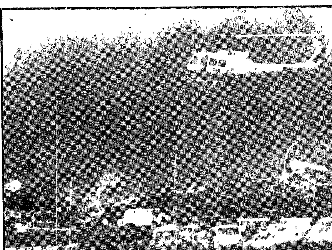
Una drammatica visione dell'incendio che ha distrutto la «Volkswagen» di San Paolo