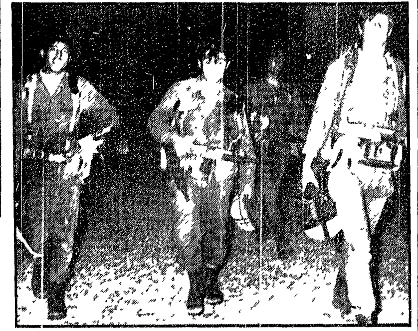
TEL AVIV — Alcuni membri di un commando israeliano che ha aggredito il villaggio di Yater, al rientro dalla feroce azione di rappresaglia

Violentissimo lo scontro con i guerriglieri, durato oltre cinque ore. Dodici partigiani, un civile e un bambino, uccisi - L'aggressione è stata compiuta da truppe trasportate con elicotteri - Tel Aviv parla di un soldato israeliano ucciso e di cinque feriti