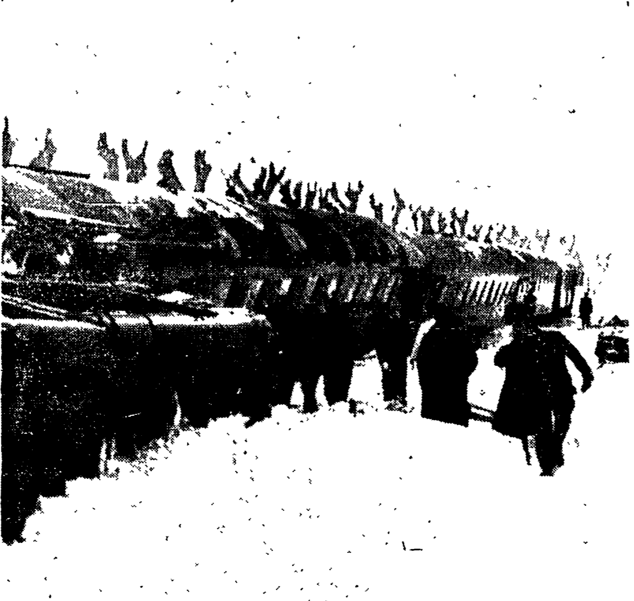
SARRAS (Francia) — Il «passaggero» Nimes-Lyon, è slittato fuori dai binari ghiacciati sebbene — assicura il macchinista — procedesse a passo d'uomo. Il convoglio si è dolcemente adagiato su un lato della massicciata, coperta da una spessa colta di neve. Grazie alla ridotta velocità solo un vagone è rimasto ferito, lievemente. La neve ha reso assai difficile l'opera dei vendicisti e dei soccorritori.

Nei primi anni della moglie lo ricorda e versa 5 mila lire per l'Unità.