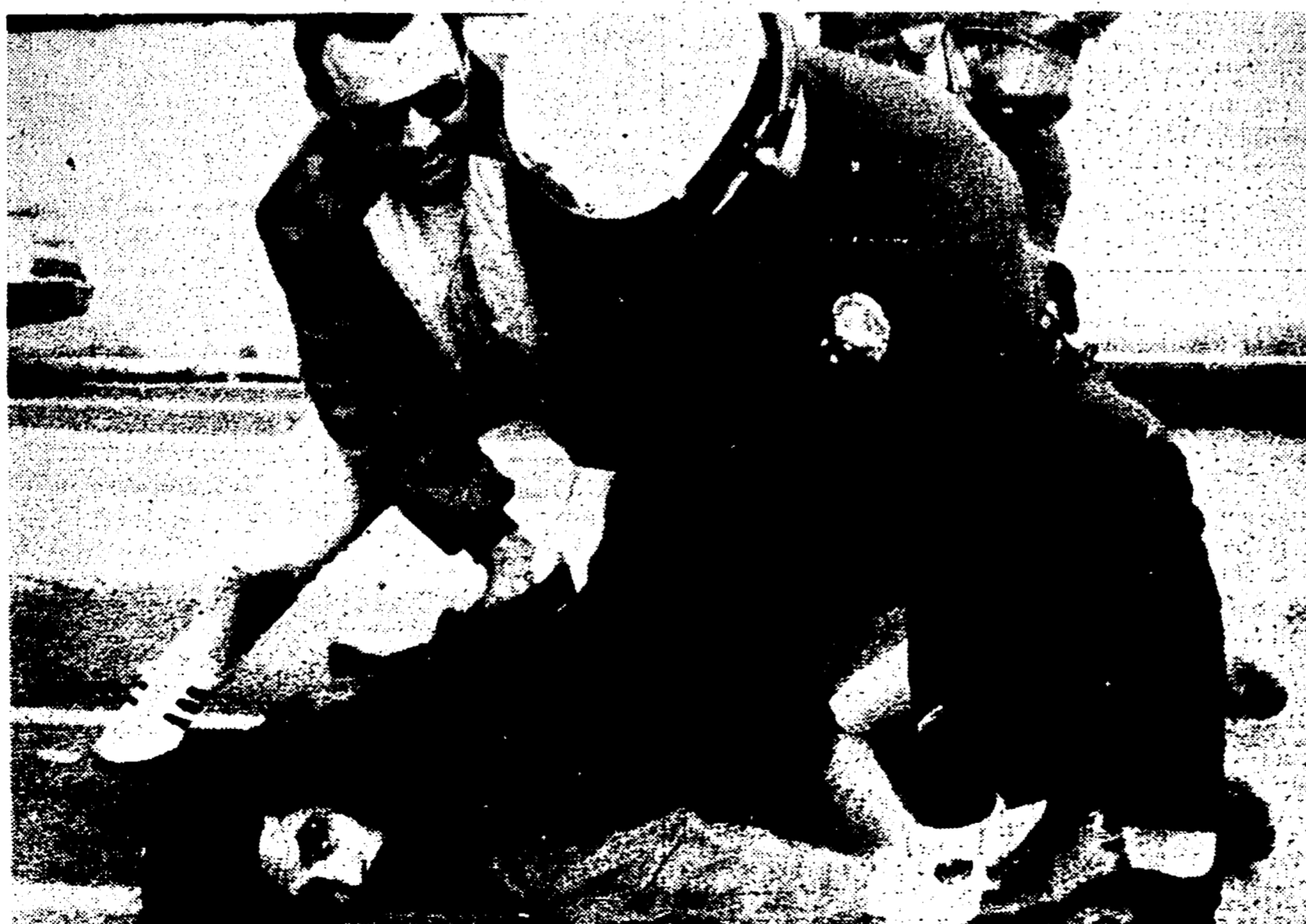
LOS ANGELES — Poliziotti malmenano brutalmente un giovane che aveva partecipato ad una manifestazione per la pace nel Vietnam. Colpa del giovane è di non credere alle false promesse di Nixon e di aver chiesto il ritiro dal Vietnam del Sud di tutte le truppe di aggressione.