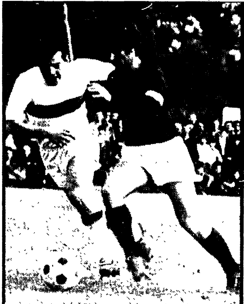
RIVERA a Cagliari toccherà il traguardo delle 300 partite giocate in serie A. Ma di Gianni si parla in questi giorni soprattutto per la sua decisione di lasciare l'hostess della quale era innamorato e per non danneggiare la sua carriera di calciatore

MILANO, 15. La commissione disciplinare della Lega ha deliberato di infliggere al Foggia, per aver trasgredito le disposizioni in merito all'applicazione dei bolli federali, un'ammonda di Lire 2.500.000; ha quindi respinto la opposizione del Catania confermando l'ammonda di Lire 750.000 e lettera di diffida; ha accolto parzialmente l'opposizione del Torino, riducendo da Lire 900.000 a Lire 600.000 l'ammonda inflitta dal giudice sportivo; ha inflitto alla Lazio un'ammonda di Lire 100.000; ha inflitto un'ammonda all'Inter e alla Roma perché responsabili del comportamento di persone ammesse in campo.