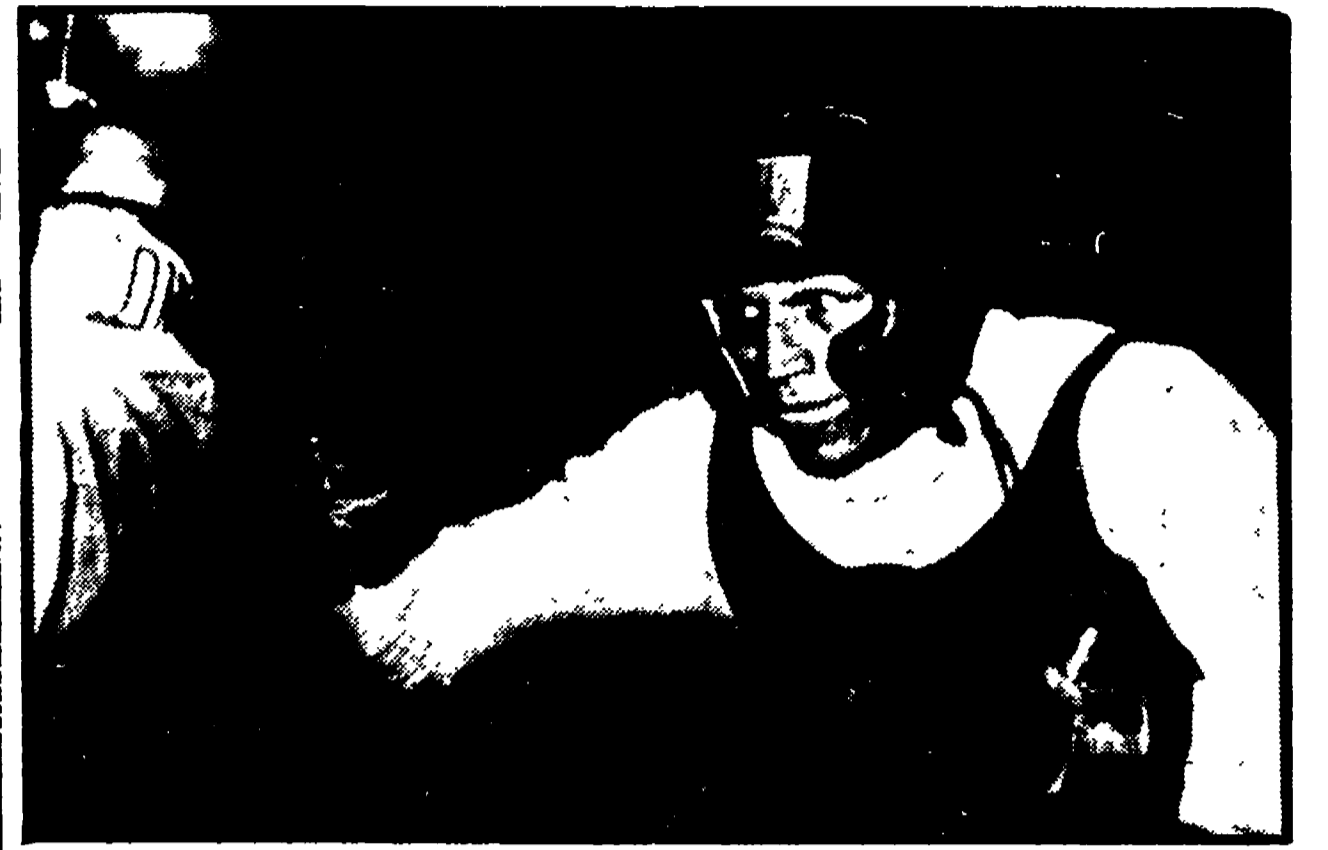
CAVI DI LAVAGNA, 20

Bruno Arcari, campione del mondo dei pesi superleggeri, si sta preparando in assoluta tranquillità per il difficile match, titolo in palio, che lo vedrà opposto, il 30 gennaio, al Palasport di Roma a Joao Henrique.