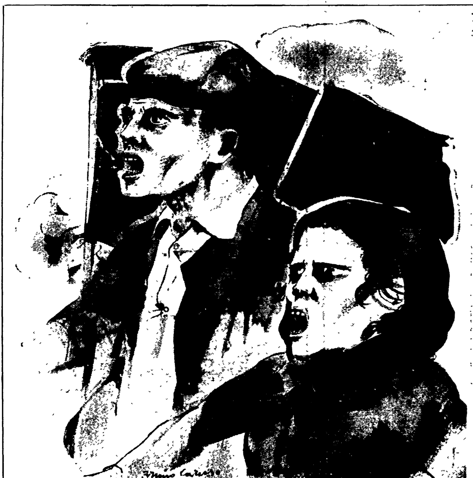
BRUNO CARUSO: « In memoria dei compagni contadini assassinati a Portella della Ginestra », 71

La storia del Partito Comunista è storia che si intreccia strettamente a quella italiana e internazionale ed è costruita dunque con il sacrificio, la passione, la consapevolezza di milioni di uomini. Ogni sintesi di questo complesso mosaico è dunque necessariamente incompleta, anche se proprio da quella molteplicità inesauribile di esperienze scaturiscono i nodi fondamentali cui quegli stessi uomini che li hanno determinati devono riferirsi. E' in questo spirito che pubblichiamo questa rapida sintesi di mezzo secolo di storia italiana e del partito attraverso le sue date di maggiore rilievo.