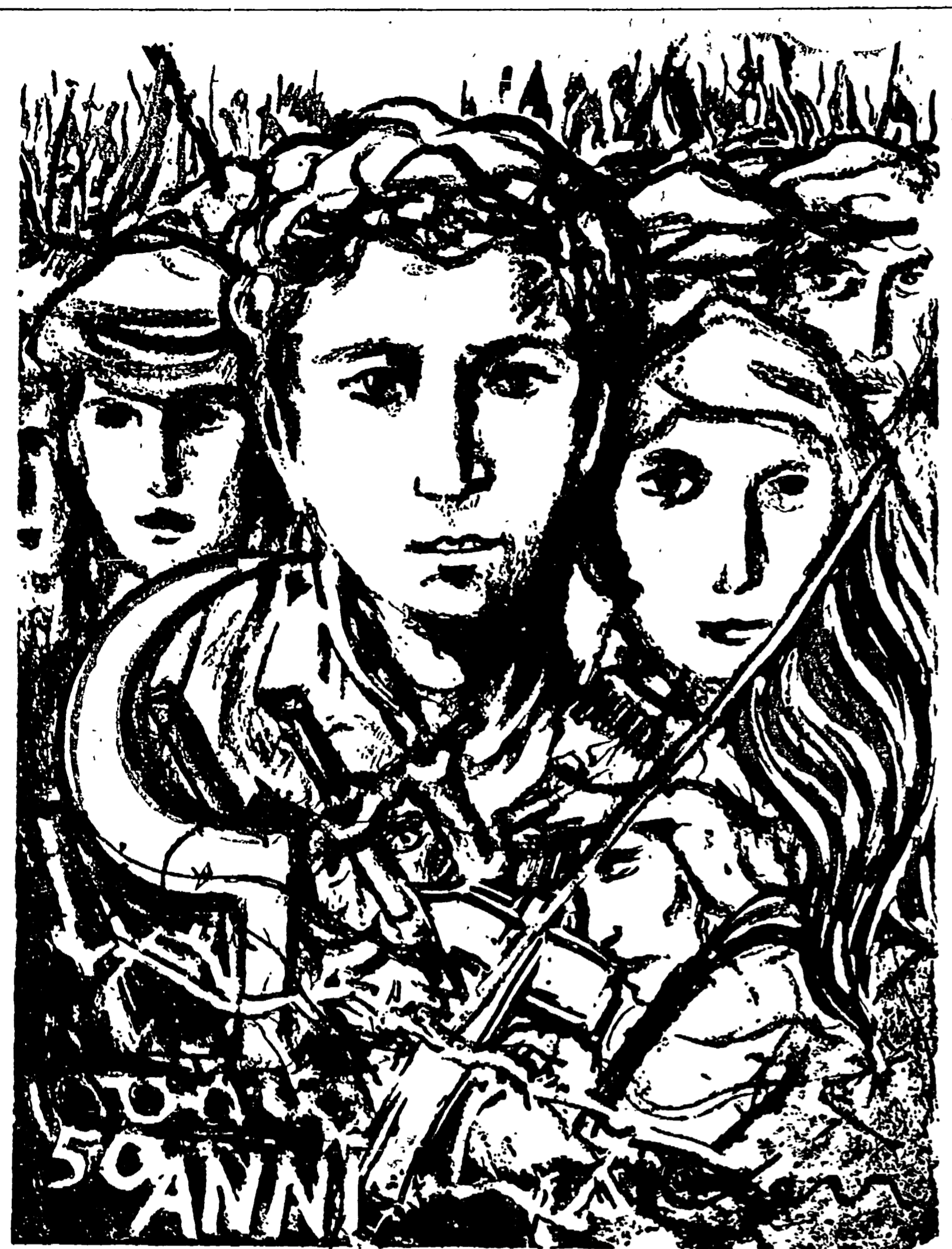
CARLO LEVI: « 50 anni: omaggio ai compagni contadini, operai, partigiani », 1971