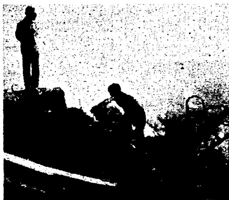
Anche ieri, per il terzo giorno consecutivo, le forze patriottiche cambogiane hanno condotto i loro attacchi a Phnom Penh, facendo tra l'altro saltare in aria una centrale elettrica. Il regime fantoccio ha esteso il coprifuoco di 12 ore all'intera capitale e ha dichiarato zona proibita 24 ore su 24 le principali arterie. Nella foto: un ponte distrutto dai patrioti. (A PAGINA 12)

Phnom Penh: fatta saltare una centrale elettrica