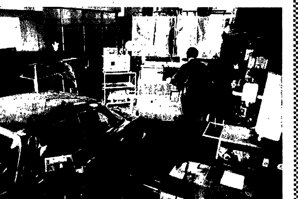
Il laboratorio per il controllo delle emissioni nello stabilimento Alfa Romeo di Milano.

Perché sono state adottate le camere di scoppio emisferiche e i carburatori doppio corpo - Attrezzati laboratori di ricerca