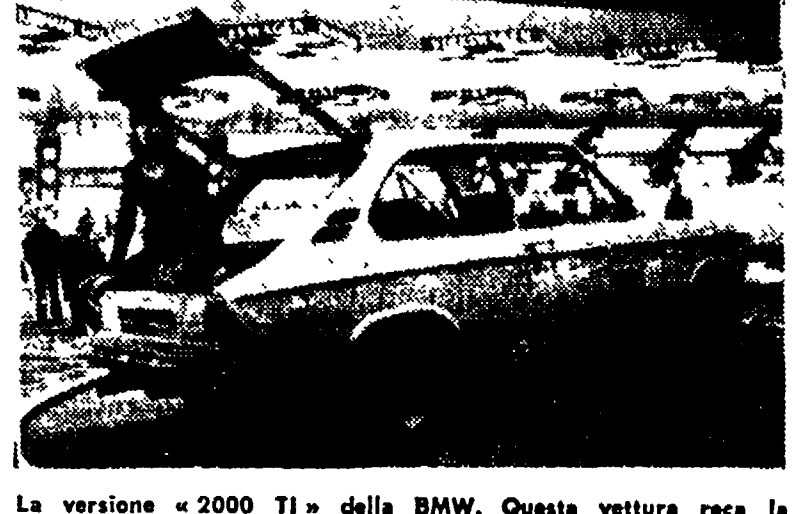
La versione «2000 TI» della BMW. Questa vettura reca la firma Karman Ghia.