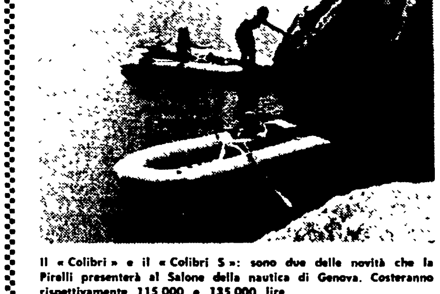
Il «Colibri» e il «Colibri 3»: sono due delle novità che la Pirelli presenterà al Salone della nautica di Genova. Costeranno rispettivamente 115.000 e 135.000 lire.