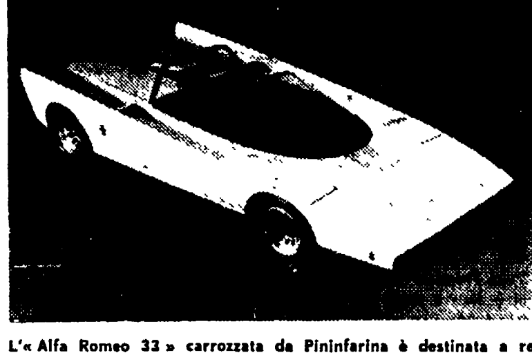
L'«Alfa Romeo 33» carrozzata da Pininfarina è destinata a restare un esemplare unico.