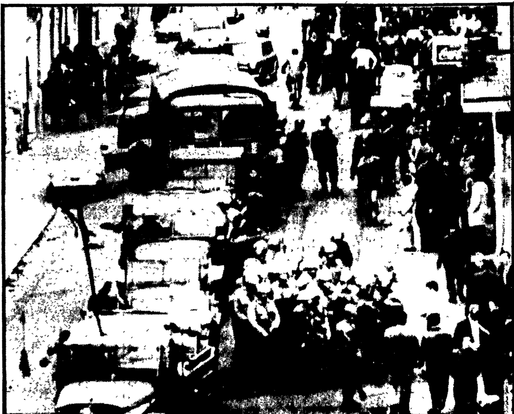
REGGIO CALABRIA - Una strada del quartiere Sbarre presa di mira dalla polizia