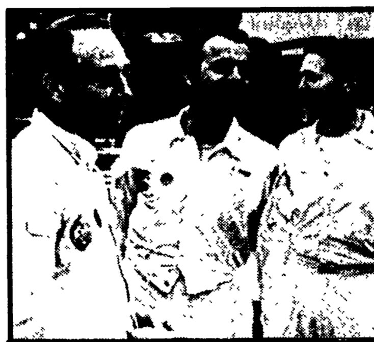
I 3 membri dell'equipaggio americano A PAG. 5