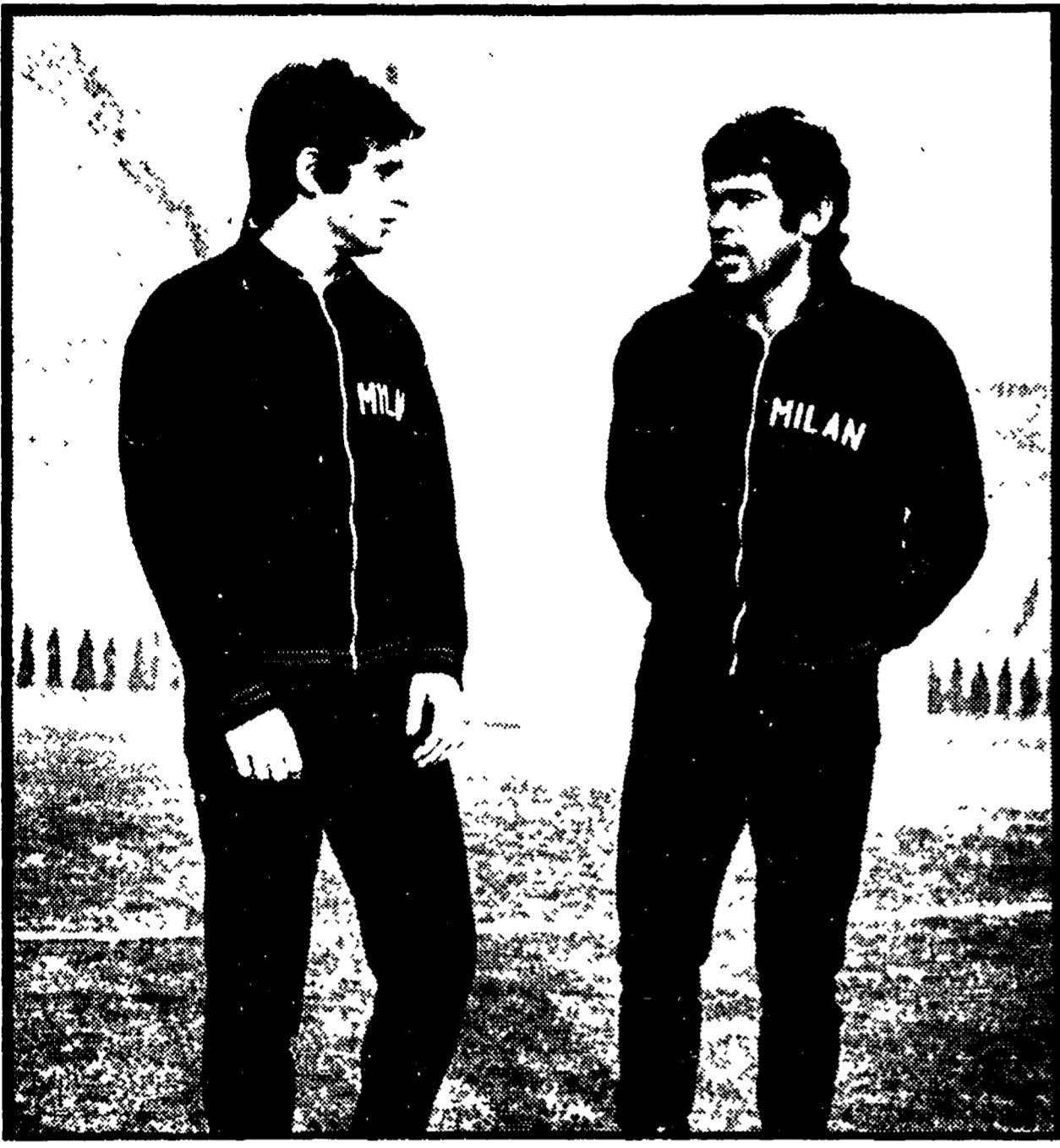
RIVIERA e COMBIN, la mente e il braccio del Milan, studiano il piano da attuare all'Olimpico